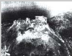
La distruzione del 1944

Nel 1349 avviene la terza distruzione di un terremoto: dello stupendo edificio fatto erigere dall'abate Desiderio non restarono che poche mura. Nella ricostruzione successiva varie sono le aggiunte e gli abbellimenti, che danno al monastero la grandezza e la monumentalità pervenuta a noi fino al 15 febbraio 1944, quando nella fase finale della seconda guerra mondiale, Montecassino venne a trovarsi sulla linea di scontro degli eserciti: il luogo di preghiera e di studio, divenuto in circostanze così eccezionali anche asilo pacifico di centinaia di inermi civili, fu, nello spazio di tre ore, ridotto a un cumulo di macerie, sotto le quali trovarono la morte molti dei rifugiati.