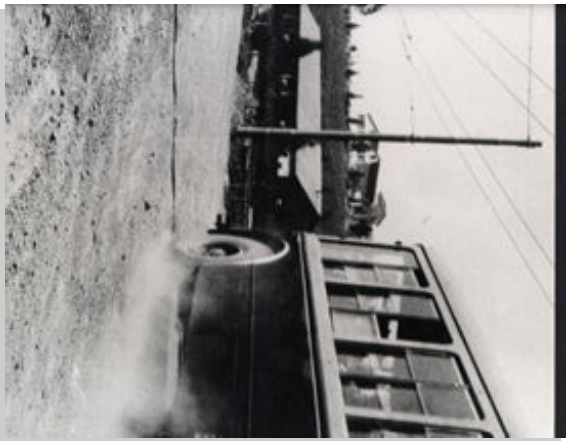
Via dei Monti di Primavalle - Anno 1955

Rai International - Italtica http://www.italica.rai.it