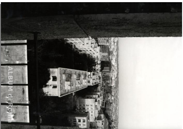
Veduta dalla chiesa di S. Maria - Anno 1989 Dal campanile della chiesa di Santa Maria della salute una veduta degli edifici 'in linea', a tutt'oggi una caratteristica di Primavalle - Anno 1989