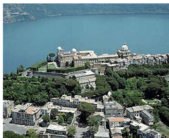
Martedì 28 Febbraio 2000 Visita alla Specola Vaticana: Palazzo Pontificio di Castelgandolfo

Questo ultimo appuntamento giunge a conclusione di un percorso realizzato in più tappe che ci ha portato ad incontrare personalità del mondo religioso e scientifico all'esterno dell'istituto.