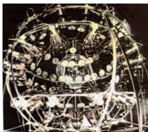
Martedì 14 Marzo 2000 Visita al Laboratorio di Fisica Nucleare del Gran Sasso