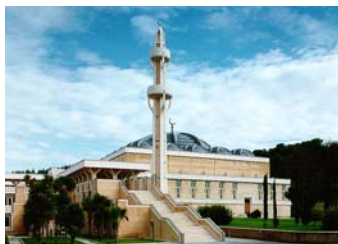
Sabato 4 Marzo 2000 Visita alla Moschea di Roma